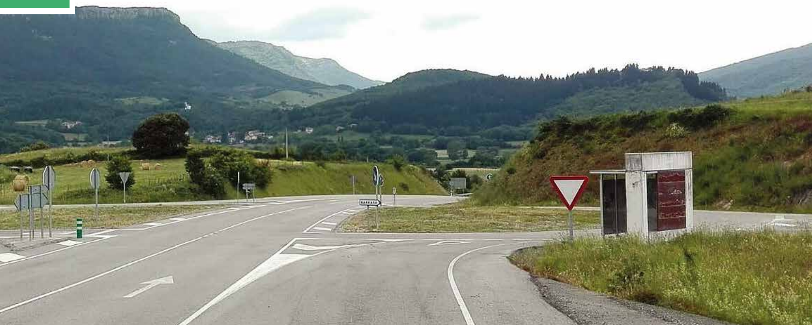
Parada del autobús, con su marquesina, en la glorieta de la localidad de Barrasa