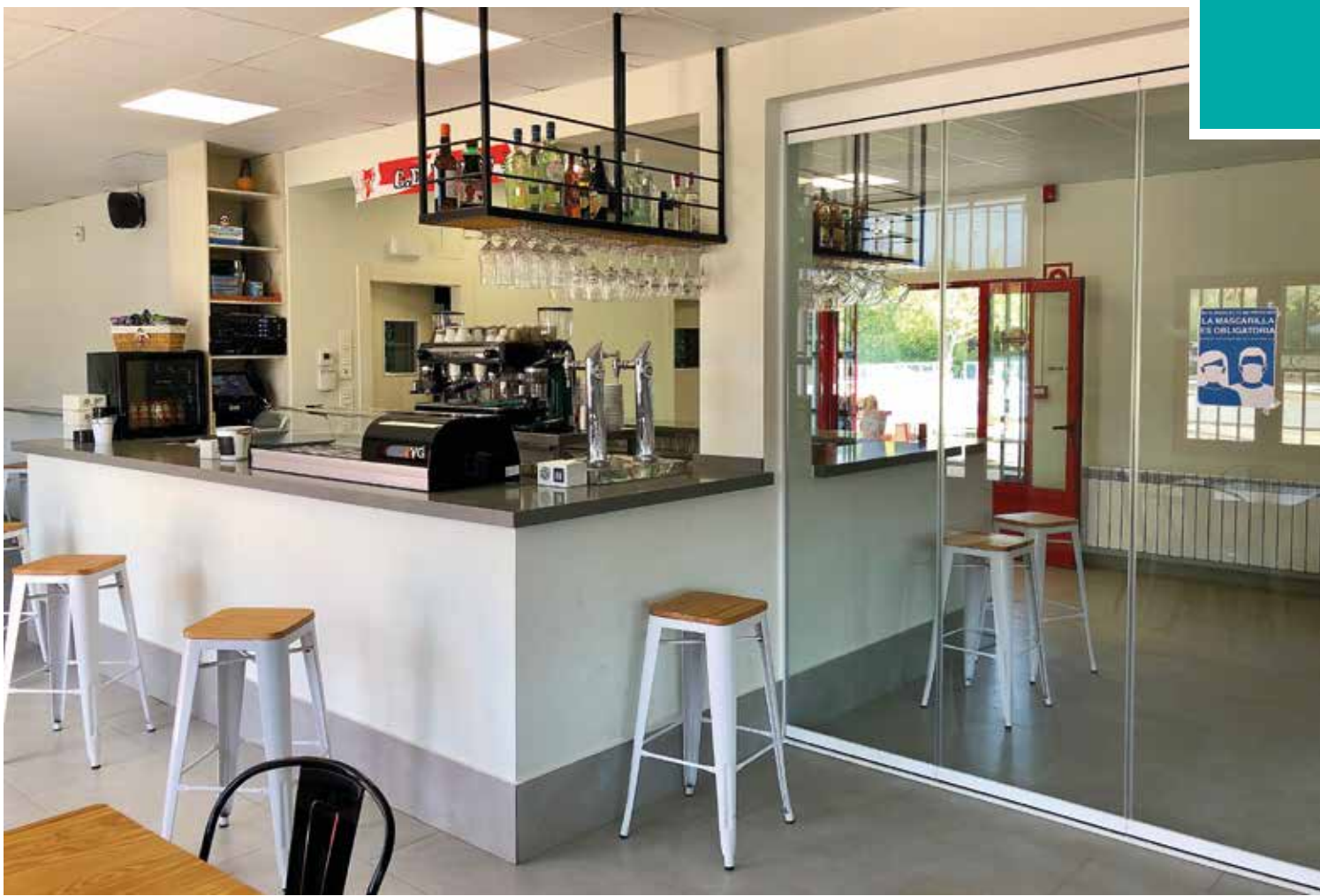
Bar-cafetería de las piscinas municipales

Las piscinas municipales, compuestas por dos vasos, uno de 25 m y otro de chapoteo para los más pequeños, han contado durante su apertura con un servicio de Socorrismo acuático y Sanitario, compuesto por dos socorristas, según lo previsto por la legislación vigente, para asegurar el uso y disfrute de las piscinas públicas con las medidas de seguridad adecuadas.