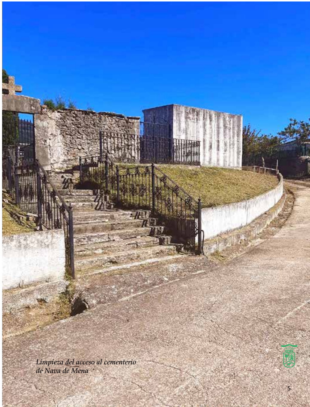
Limpieza del acceso al cementerio de Nava de Mena

"El Ayuntamiento sufraga el gasto anual en mantenimiento del alumbrado público de todos los pueblos y de la red municipal de caminos y carreteras"