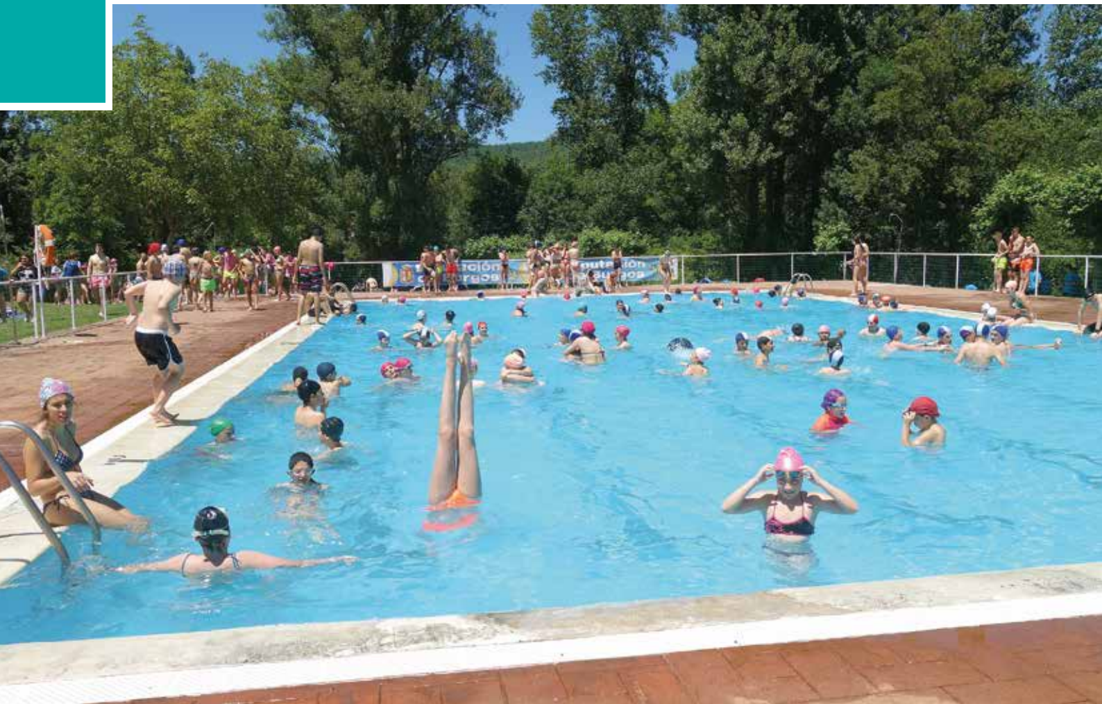
Piscinas municipales. Foto de archivo

mantenimiento de instalaciones de piscina de la temporada 2020 establecidos en el ACUERDO 29/2020, de 19 de junio, de la Junta de Castilla y León, por el que se aprueba el Plan de Medidas de Prevención y Control para hacer frente a la crisis sanitaria ocasionada por la COVID-19, en la Comunidad de Castilla y León.