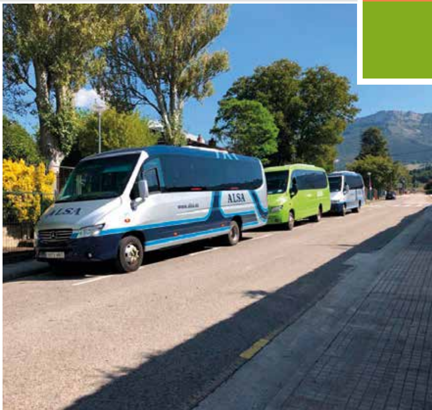
ALSA es la concesionaria del transporte escolar

res en el cole" se ha trasladado este curso a un aula del Centro Cívico cedida por el Ayuntamiento, pegada a la biblioteca municipal, al necesitar el colegio ampliar espacios para impartir las clases respetando la distancia de seguridad. "Madrugadores en el cole" es un programa municipal diseñado para conciliar la vida laboral familiar y la escolar. Especialmente para facilitar la atención de niños y niñas cuyos padres tienen un horario laboral que no coincide con el escolar. Su horario es de 7:15 a 9:15 horas.