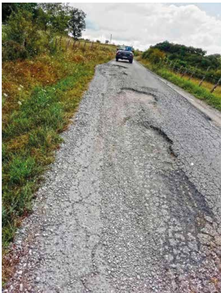
Estado actual del firme de la carretera de El Berrón a Bortedo

que ha ofrecido ejecutar esta obra en el precio de 216.785,03 euros, lo que supone una baja del 22,46% sobre el tipo de licitación. La adjudicación definitiva del contrato fue acordada por la Junta de Gobierno el 4 de septiembre.