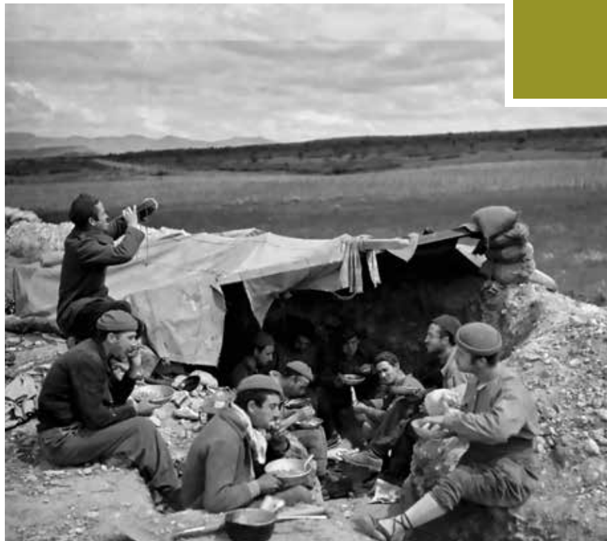
Milicianos republicanos en una trinchera

La fotografía como arte y, sobre todo, como elemento transmisor del mensaje informativo, alcanzó en los años treinta del siglo XX su madurez absoluta. La Guerra Civil Española, enmarcada cronológicamente en este momento en el que la tecnología, con las nuevas cámaras y películas, permitía los elementos necesarios para dar rienda suelta a la creatividad del fotógrafo, constituyó no obstante sus trágicas consecuencias, un campo de actuación idóneo para esta forma de expresión.