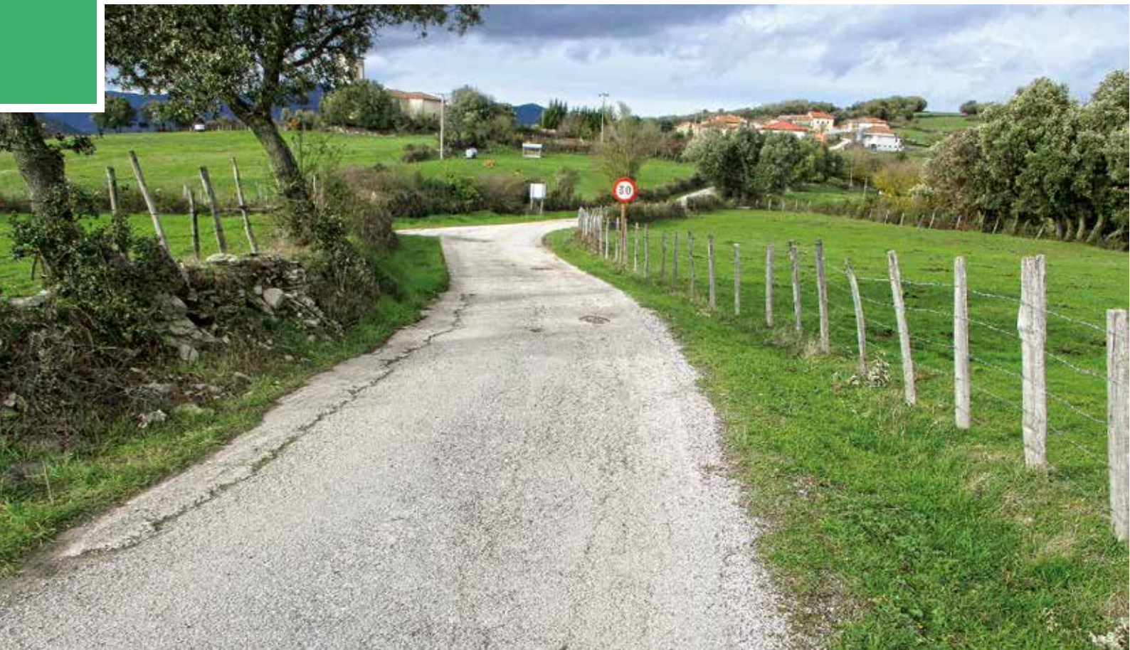
La capa de rodadura de la carretera de acceso a Viergol se encuentra muy deteriorada

la Mesa de Contratación para la apertura de las cuatro ofertas presentadas por otras tantas empresas. ASYPA (Asfaltos Y Pavimentos 2015,S.L.) fue la empresa que mejor oferta realizó, ofreciendo ejecutar las obras en el precio de 107.677,90 euros, realizando una baja del 12,47% sobre el presupuesto base de licitación. La Junta de Gobierno en su reunión del 4 de septiembre acordó la adjudicación provisional del contrato a esta empresa de acuerdo con la propuesta de la Mesa de Contratación.