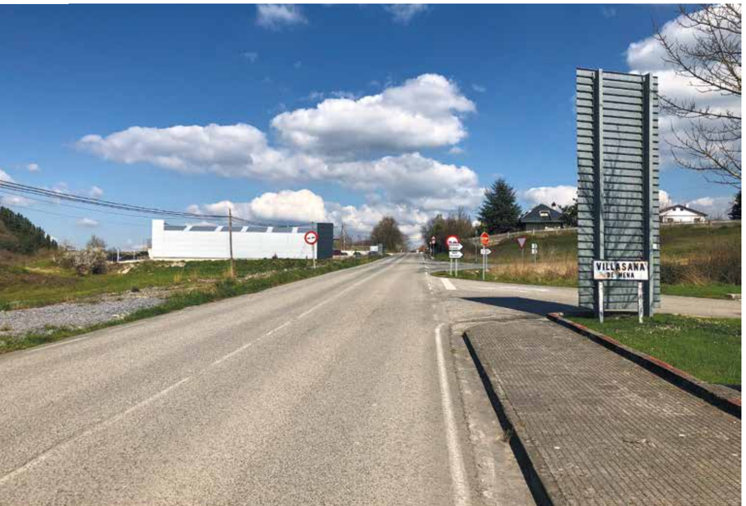
Tramo de la travesía desde la Cruz Roja de Villasana hasta el barrio de Mercadillo que se va a urbanizar

"Se trata de la intervención viaria más potente a realizar en el municipio en la presente legislatura o mandato municipal, al menos hasta la fecha"