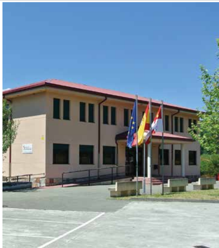
IES Doctor Sancho de Matienzo