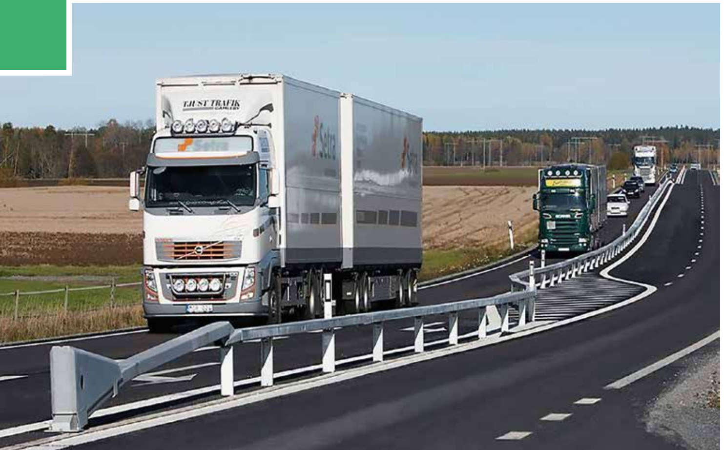
Comienzo de un tramo del tipo 2+1 en una carretera de Cataluña que permite adelantar sin riesgo de colisión frontal

"Los estudios de tráfico señalan que en el tramo El Berrón-Villasana de Mena la intensidad media diaria (IMD) de vehículos es 7.014 veh/día y que en el tramo Villasana de Mena-Bercedo es de 4.490 veh/día"