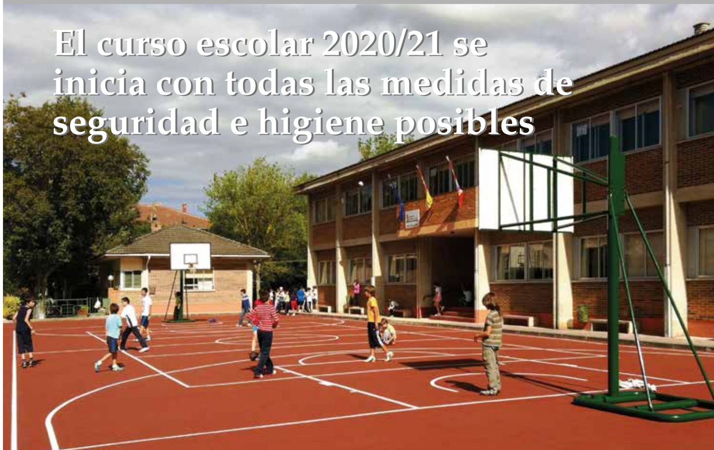
Colegio público Nta. Sra. de las Altices de Villasana de Mena.