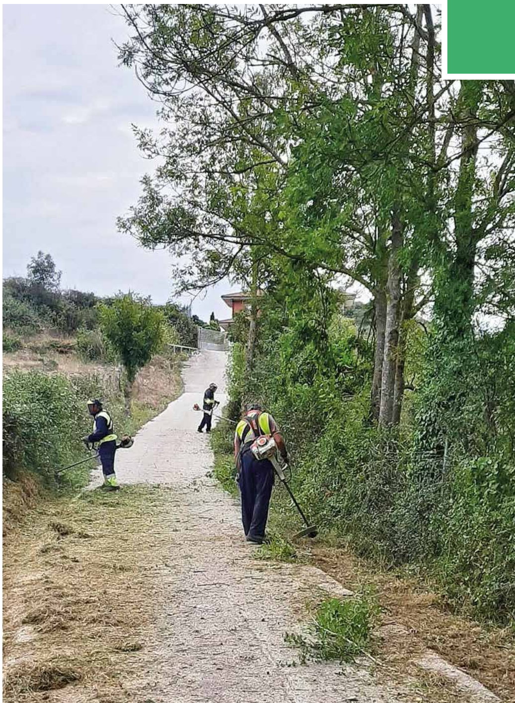
Trabajadores del Plan Municipal de Empleo desbrozando un camino en Menamayor

Pueden, asimismo, ejecutar las obras y prestar los servicios que les delegue expresamente el Ayuntamiento. Hoy en día son 25 pedanías menesas las que tienen delegada o vienen prestando desde tiempo inmemorial la gestión del servicio domiciliario de agua potable: Angulo, Arceo, Bortedo, Barrasa, Burceña, Campillo, Concejero, Covides, Gijano, Hornes, Irus, La Presilla, Leciñana, Maltrana, Maltranilla, Partearroyo, Ribota, Santa María del Llano de Tudela, Sante-