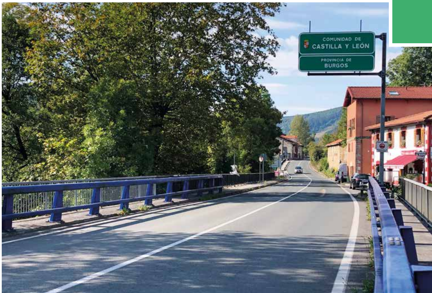
La carretera autonómica CL-629 finaliza en El Berrón en el límite con la comunidad autónoma vasca

La actual carretera está formada por un solo carril por sentido, con arceles relativamente amplios y un firme en buen estado. La presencia de numerosas intersecciones, así como las condiciones de visibilidad hacen que los tramos en los que se posibilita el adelantamiento son escasos, lo que junto con el tráfico pesado y las fuertes rampas en algunos tramos de la carretera dificultan la fluidez de la circulación, especialmente en los fines de semana y periodos vacacionales. Las variantes de población de Vivanco, Maltrana, La Presilla y El Berrón están sin ejecutar.