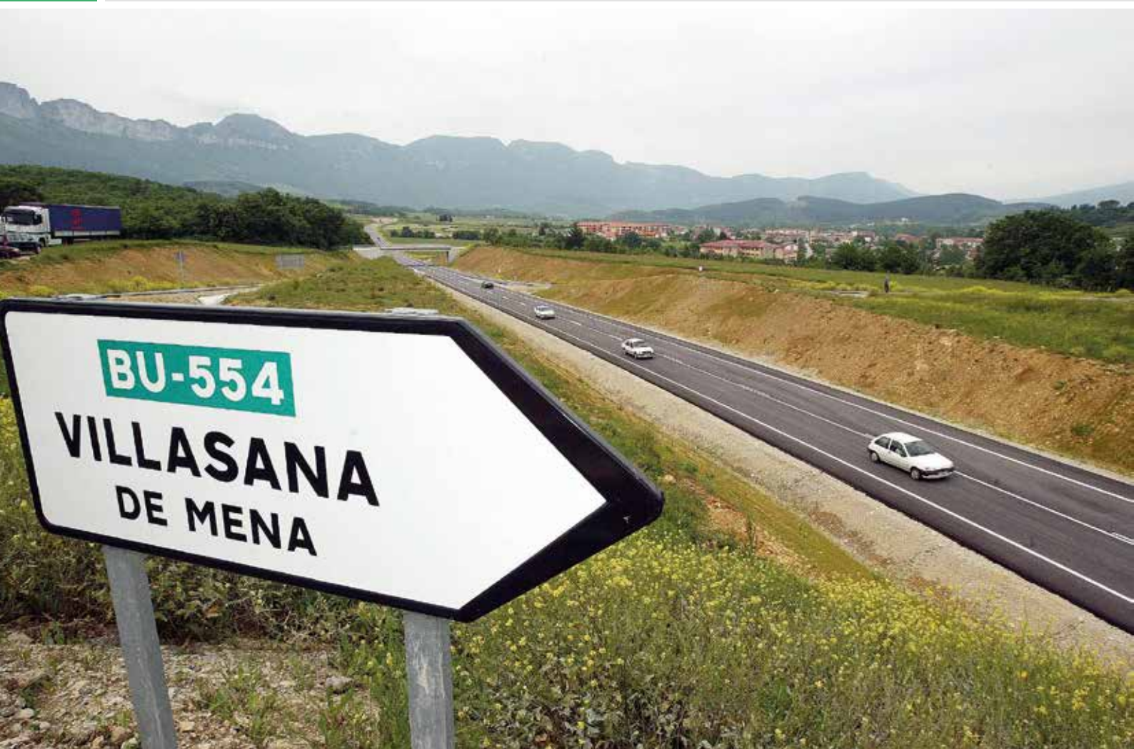
Variante de Villasana de Mena inaugurada en 2005

Se decanta por aumentar la capacidad de la vía con una sección 2+1 en el tramo de unos 10 kilómetros, comprendido entre El Berrón y Villasana de Mena