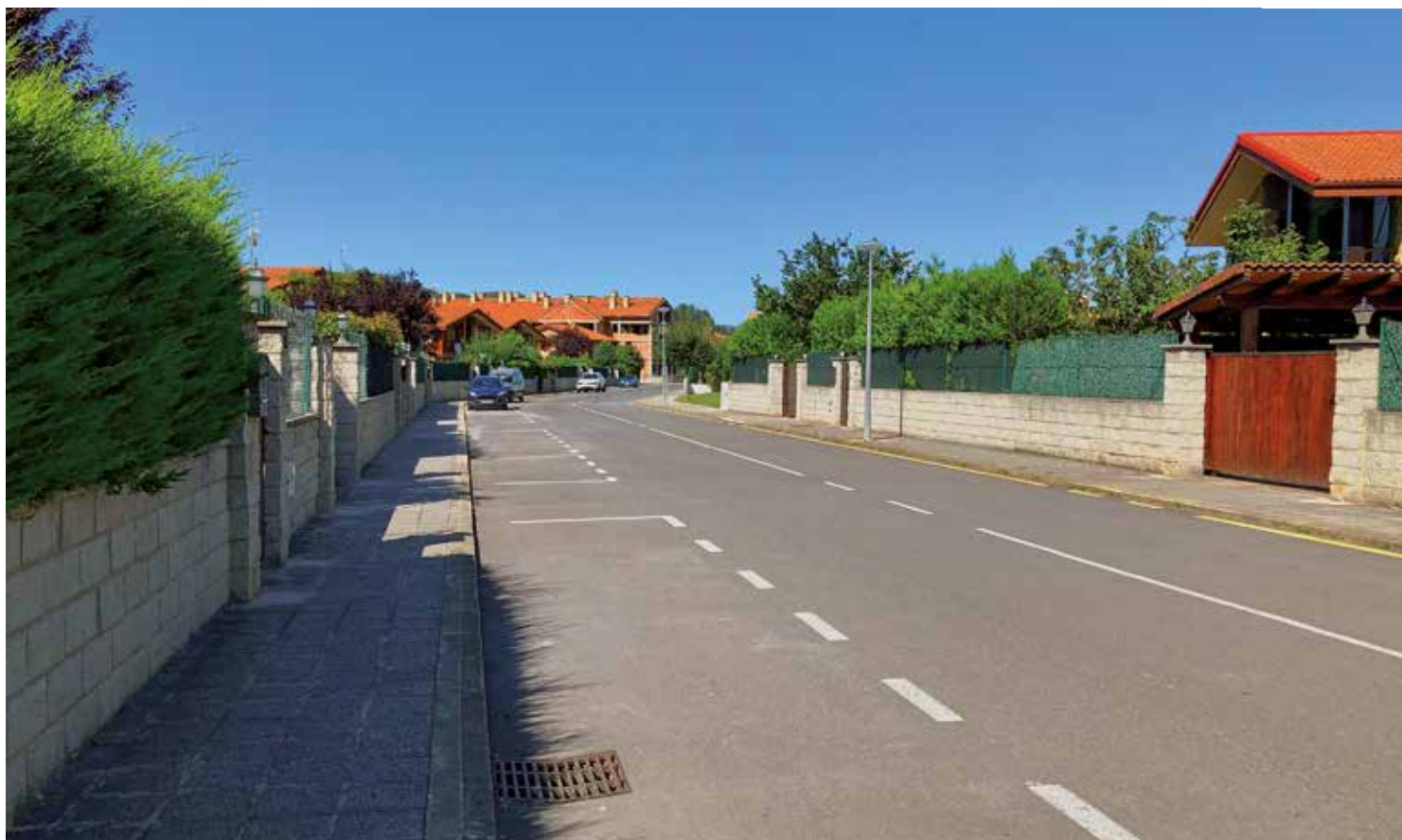
Limpieza viaria en la calle Arenilla de Villanueva de Mena

ros, Entrambasaguas, con 182 vecinos que percibirá 23.922,01 euros, Sopenano, con 166 vecinos que recibirá 22.346,45 euros, Lezana de Mena, con 118 vecinos que ingresará 16.819,76 euros, Nava de Mena, con 137 vecinos que ingresará 18.690,74 euros, y Maltranilla, con 117 habitantes que tiene asignados 16.721,29 euros.