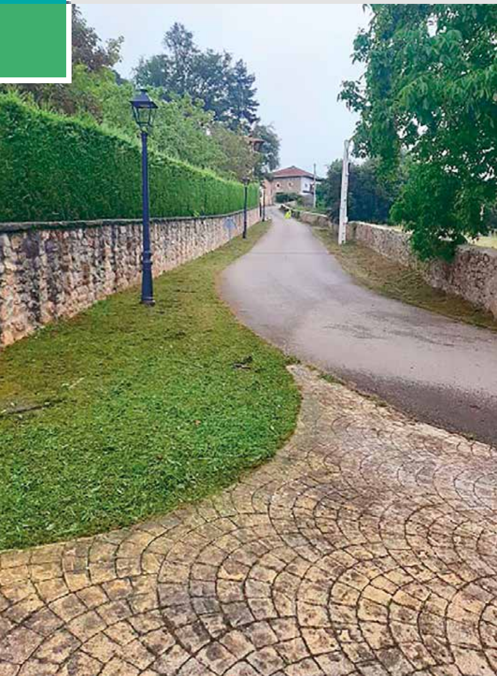
Una calle de la entidad local menor de Barrasa.

"Para el ejercicio de sus competencias las Juntas Vecinales disponen de los recursos propios procedentes de la administración de su patrimonio"