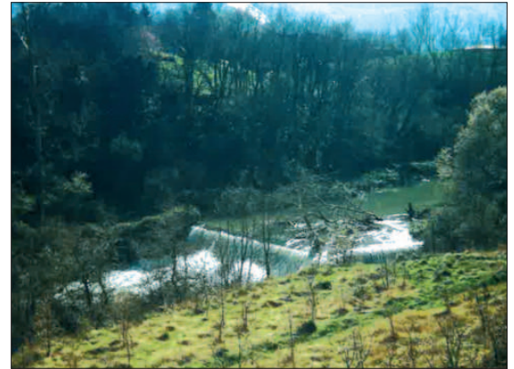
Presa de la ferrería molino de Cerezo de Entrambasaguas.

singular en forma de "L" de 4 metros de altura que contenía un remanso aguas arriba que era el mejor criadero de truchas de este río. Su destrucción ha provocado graves consecuencias. Las aguas que estaban remansadas traspasaban ahora libremente causando