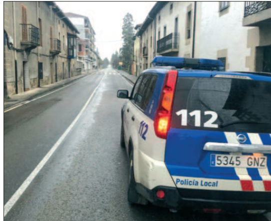
El lunes 30 de marzo la travesía de Villasana se encontraba vacía de gente.

En cuanto a las medidas extraordinarias adoptadas para proteger la salud de los miembros de la corporación municipal y garantizar el propio gobierno del municipio, cabe destacar la suspensión de las Comisiones Informativas Municipales, al estar compuestas por siete concejales, hasta que no se declare oficial-