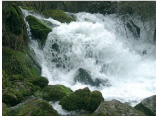
Nacimiento del Cadagua

Es necesario tomar medidas y actuaciones para poder recuperar su flora y fauna con aguas limpias, para ello hay que mentalizar a sus riverenños en el sentido de que hay que mantener el río limpio y no tirar nada a su cauce, teniendo un buen servicio municipal de recogida de basuras, residuos y enseres.