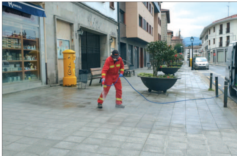
Desinfectando un paseo de Villasana de Mena.

Los servicios municipales de limpieza y protección Civil se están centrando en la limpieza de calles y desinfección de las más céntricas y comerciales de Villasana, por donde transitan a diario los vecinos para hacer la compra, y de los accesos al Centro de Salud y Residencias de Ancianos. También en la desinfección de pasamanos y tapas de contenedores y otro mobiliario urbano.