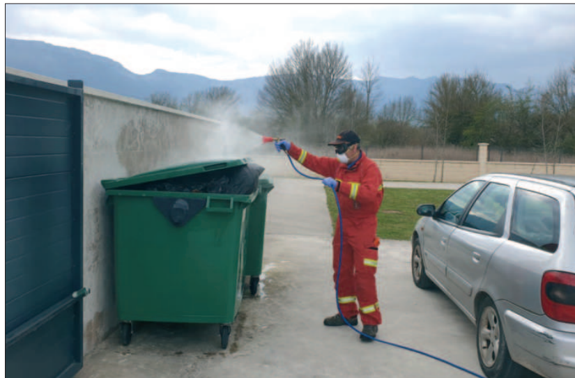
Desinfectando contenedores en la residencia de mayores de Maltrana.

Lamentablemente, también se ha evidenciado cómo una pequeña minoría de ciudadanos no viene observando las medidas restrictivas de movilidad que