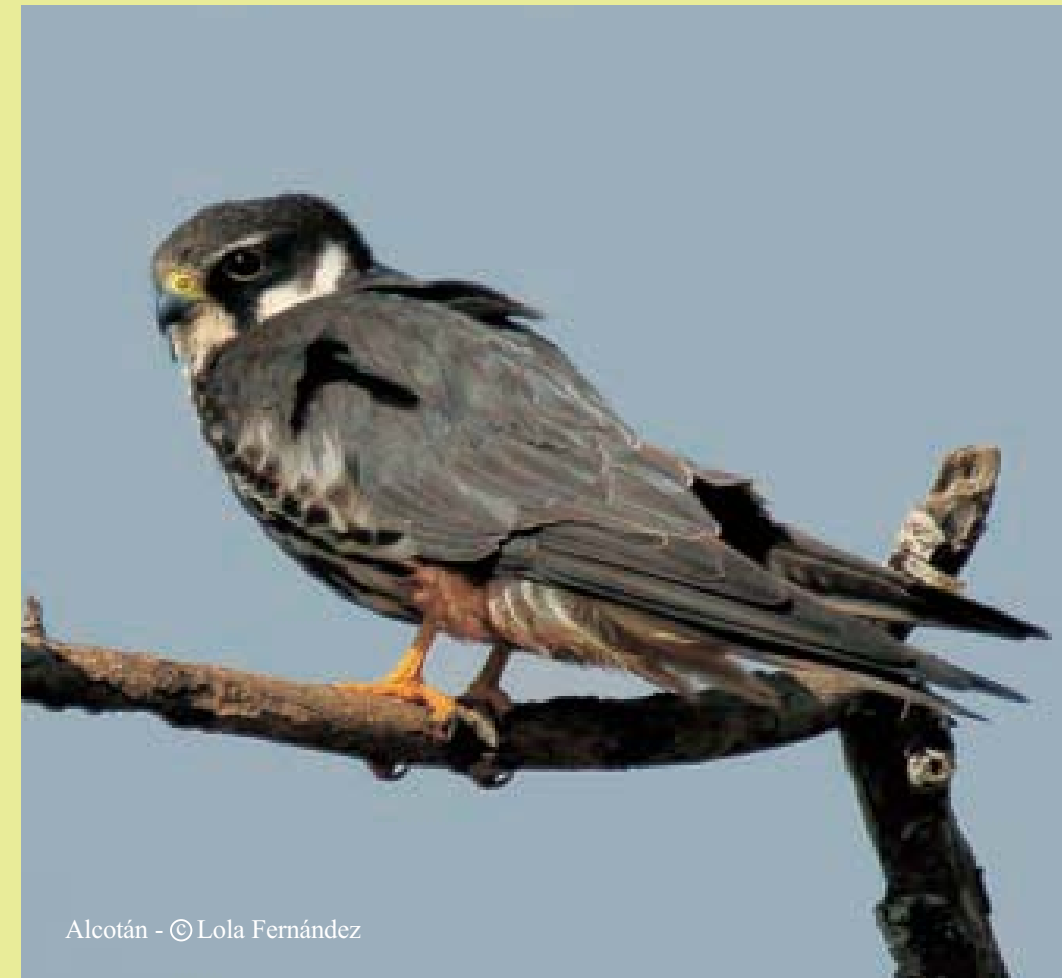
Alcotán - © Lola Fernández

Cormorán grande Phalacrocorax carbo Garcilla bueyera Bubulcus ibis Garza real Ardea cinerea Milano real Milvus milvus Chocha perdiz Scolopax rusticola Mirlo capiblanco Turdus torquatus Estornino pinto Sturnus vulgaris