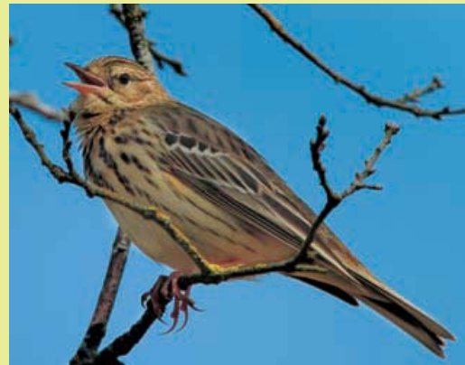
Bisbita arbóreo

Cerceta Carretona Anas querquedula Águila pescadora Pandion haliaetus