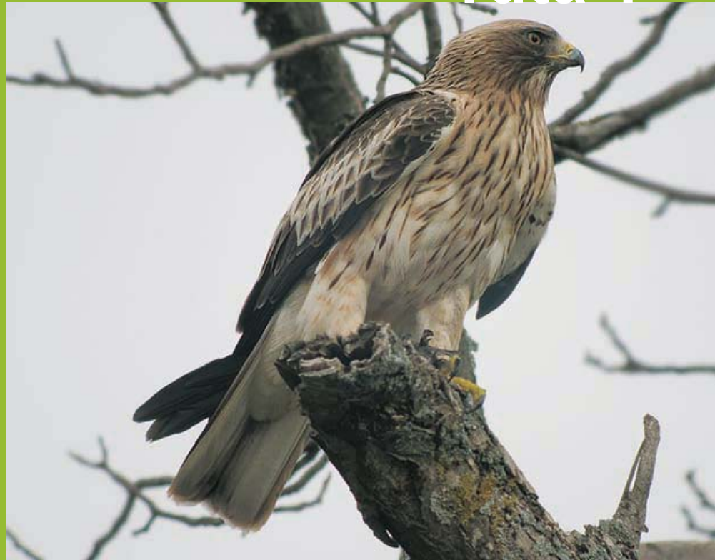
Águila calzada