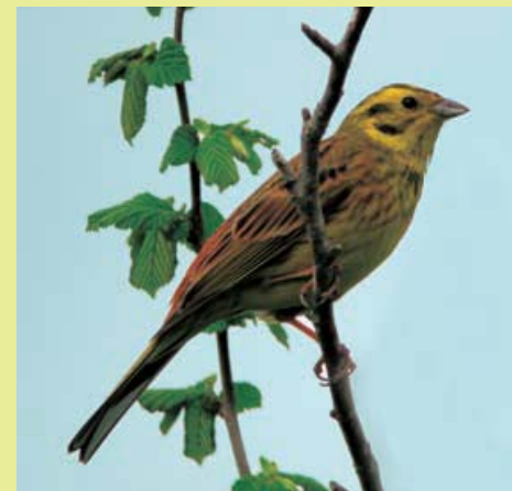
Escribano cerillo - © Lola Fernández

Cigüeña blanca Ciconia ciconia Alimoche Neophron pernocterus Culebrera europea Circaetus gallicus Aguililla calzada Hieratus pennatus Milano negro Milvus migrans Abejero europeo Pernis apivorus Alcotán Falco subbuteo Codorniz Coturnix coturnix Tórtola común Streptopelia turtur Vencejo real Apus melba Torcecuello Jynx torquilla Avión zapador Riparia riparia Avión roquero Ptyonoprogne rupestris Bisbita campestre Anthus campestris Bisbita arbóreo Anthus trivialis Colirrojo real Phoenicurus phoenicurus Collalba gris Oenanthe oenanthe Roquero rojo Monticola saxatilis Buscarla pintoja Locustella naevia Papamoscas gris Muscicapa striata Papamoscas cerrojillo Ficedula hypoleuca