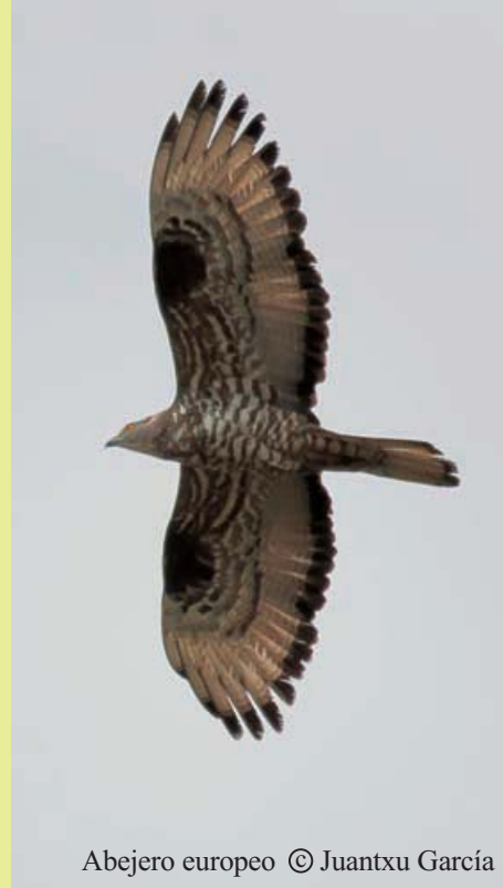
Abejero europeo

Pico menor Dendrocopos minor Lavandera cascadeña Motacilla cinerea Curruca rabilarga Sylvia undata Curruca cabecinegra Sylvia melanocephala Trepador azul Sitta europea Chova piquigüalda Pyrrhocorax graculus Gorrión chillón Petronia petronia Pardillo común Carduelis cannabina Jilguero Carduelis carduelis Camachuelo común Pyrrhula pyrrhula Escribano cerillo Emberiza citrinella Escribano soteño Emberiza cirlus Escribano montesino Emberiza cia