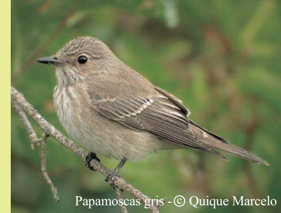
Papamoscas gris